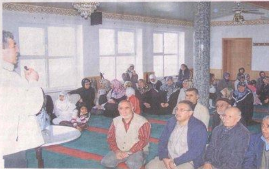
Ein Blick in die Kelheimer Moschee. Das Gebäude in der Giselastraße 45 ist Treffpunkt und Gotteshaus des Türkisch-Islamischen Vereins.

Die zweite Integrationsbeauftragte Dürdane Özdemir (39) stellt fest, in erster Linie fasteten Muslime für sich selbst. „Gott möchte, dass es uns gut geht. Wir tun das für uns und dann erst für ihn.“ Wer im islamischen