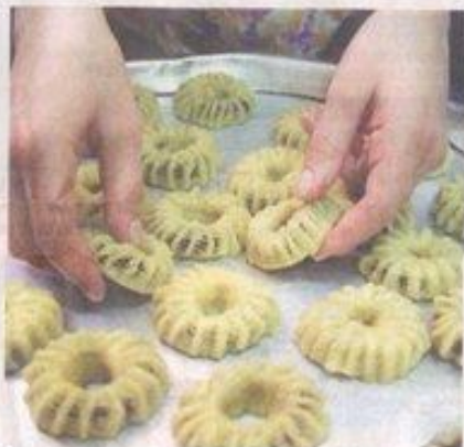
Selbst gebackene Kekse werden am Ende des Ramadan beim Fastenbrechen serviert.