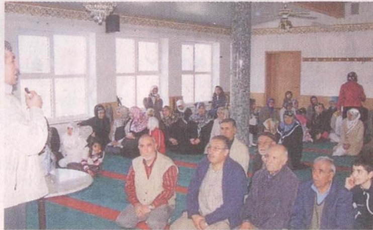
Ein Blick in die Kelheimer Moschee